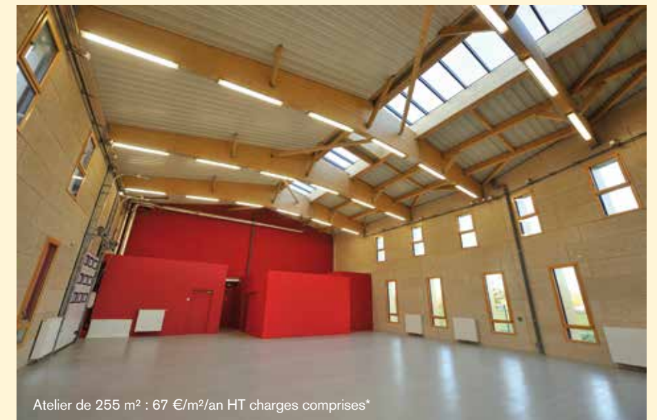
Atelier de 255 m 2 : 67 €/m 2 /an HT charges comprises*