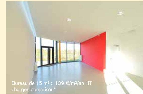
Bureau de 15 m 2 : 139 €/m 2 /an HT charges comprises*