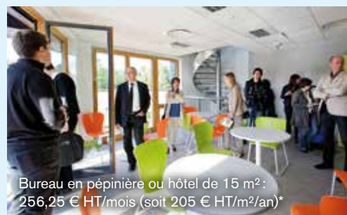
Bureau en pépinière ou hôtel de 15 m 2 : 256,25 € HT/mois (soit 205 € HT/m 2 /an)*