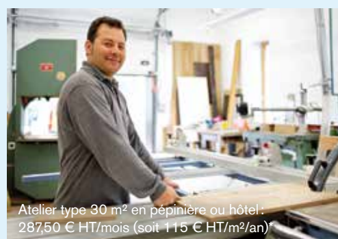
Atelier type 30 m 2 en pépinière ou hôtel : 287,50 € HT/mois (soit 115 € HT/m 2 /an)*

*: Électricité, eau, chauffage, accès internet et nettoyage des parties communes compris